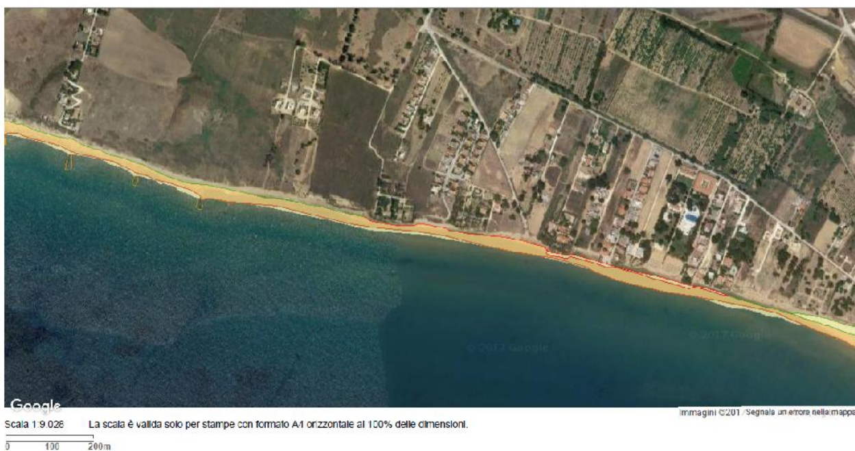
Foto aerea dell'area oggetto d'intervento