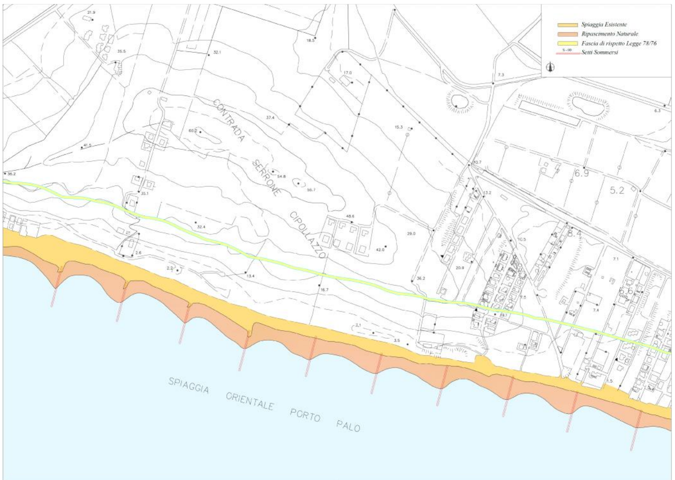
Planimetria con l'ubicazione dei pennelli sommersi