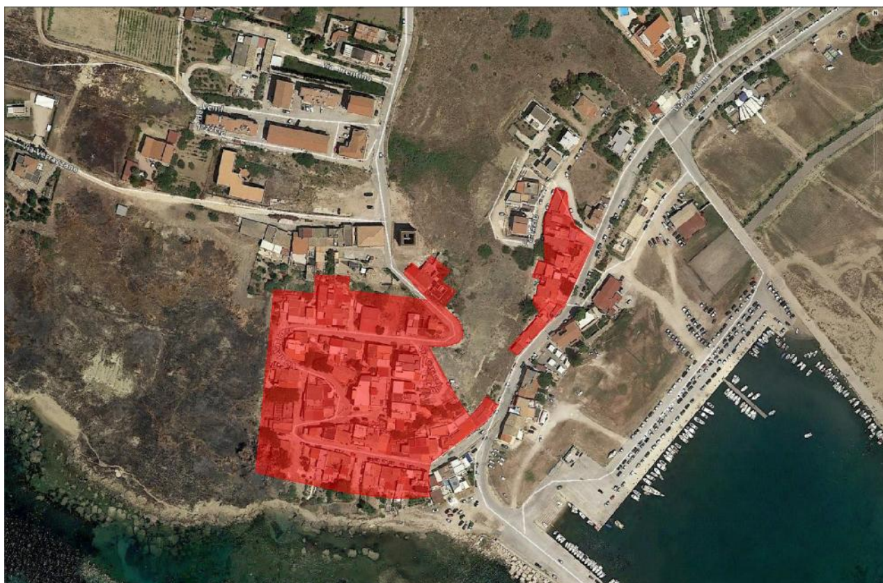
Foto aerea dell'area oggetto d'intervento